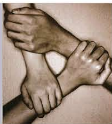
版面內容由「與愛同行」提供