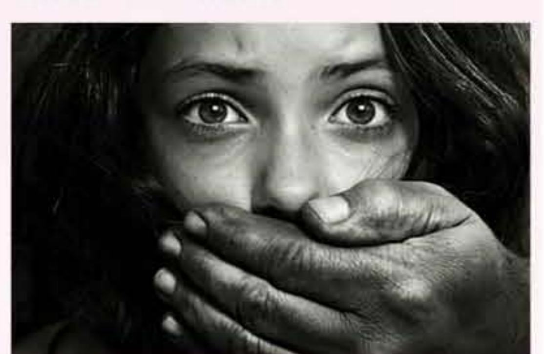
○世界上最其中一項最嚴重的罪惡—販運人口,就是人口販賣。

中國雲南的邊境,正是當今其中一個人口販子的集散地。從越南、緬甸、柬埔寨及寮國等地區,都有自願或非自願的人口販運受害者。所謂「自願的受害者」,往往是被人誘騙而來的,一些年輕的少女聽到別人游說,到了中國城市可以每月賺上數百萬元越南盾(約數千元人民幣)。人口販子給她們過關入中國,然後把她們帶到一些髮廊,向人們提供性服務。她們往往被游說可以先試做幾個月,不喜歡的話可以回去。但習慣了「躺著賺錢」的生活,便很難回頭。有一些則再被賣到落後農村或其他國家做新娘。