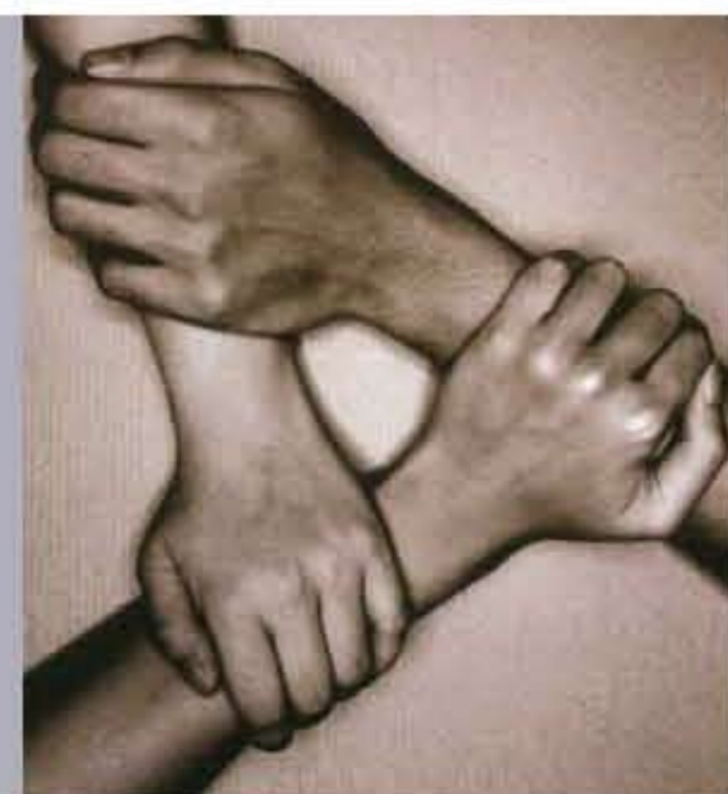
版面內容由「與愛同行」提供